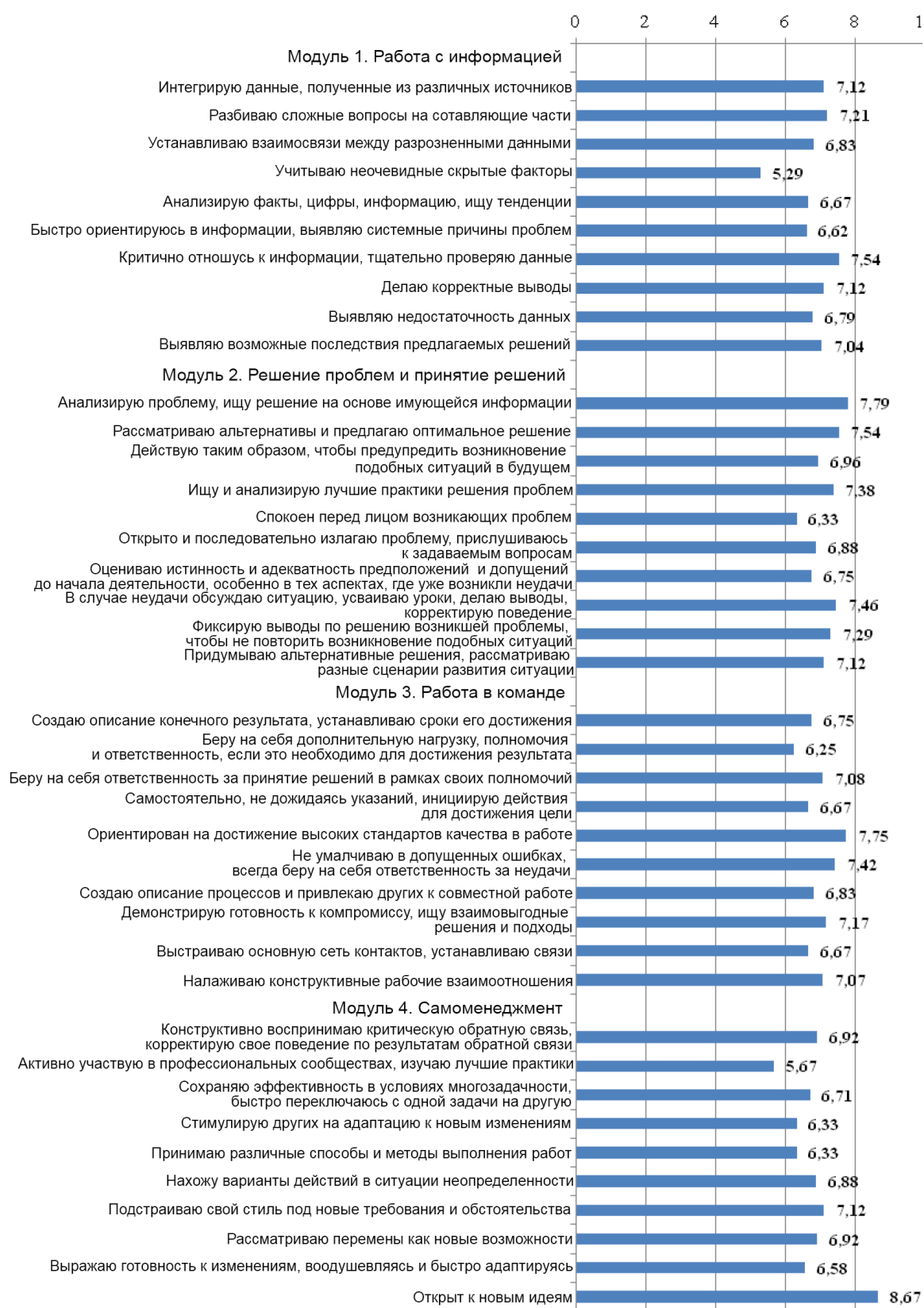
Рис. 2. Результаты анкетирования обучающихся «Компетенции XXI века» в разрезе каждого модуля Fig. 2. The results of the students' survey "Competencies of the XXI century" in the context of each module